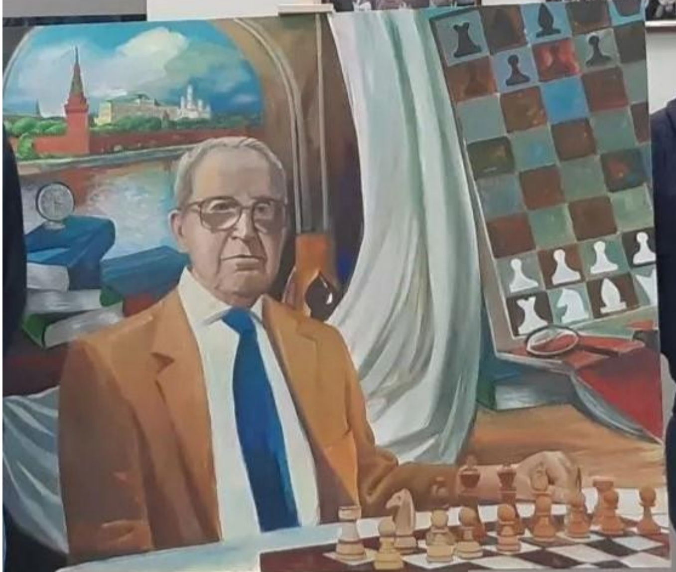
Международный гроссмейстер, шахматный композитор, чемпион СССР Авербах Ю. Л.